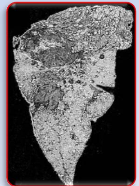
شش مبتلا به سیلیکوزیس