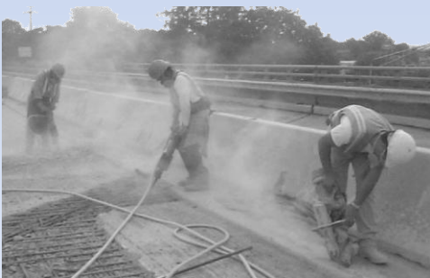
کارگران راهسازی که در معرض گرد و غبارند.