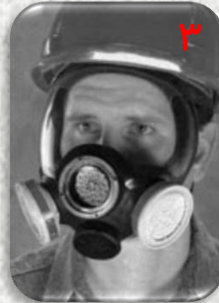
انواع ماسک به ترتیب قدرت حفاظتی